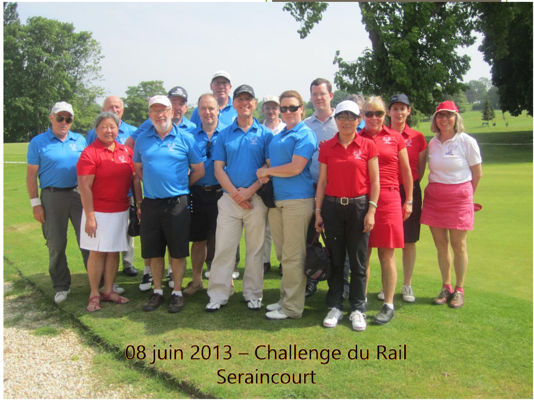
08 juin 2013 – Challenge du Rail Seraincourt